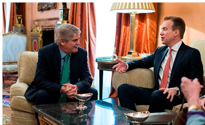
El entonces ministro de Asuntos Exteriores y de Cooperación Alfonso Dastis, junto a su anterior homólogo noruego Boerge Brende. Madrid, 22 de diciembre de 2016