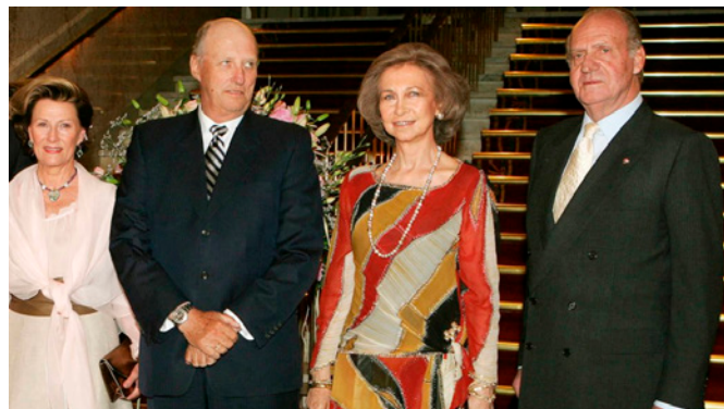
Visita a Oslo de SSMM Don Juan Carlos y Doña Sofía con motivo del 80º aniversario de los reyes de Noruega Harald y Sonia. Oslo, 10 de mayo de 2017