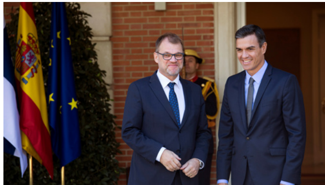
El presidente del Gobierno Pedro Sánchez, durante su reunión con el anterior primer ministro de Finlandia, Juha Sipilä.- Madrid 04/10/2018. Palacio de La Moncloa.

Para Finlandia también reviste una particular importancia la relación con sus países vecinos, especialmente con Suecia, como lo demuestra su pertenencia al Consejo Nórdico y el hecho de cultivar unas relaciones intensas con los países bálticos. Finlandia preside durante este año el Consejo Nórdico de Ministros. En su área geográfica más cercana Finlandia también considera la región ártica como prioritaria, habiendo presidido el Consejo Ártico durante el bienio 2017-2019. En el ámbito del Báltico cabe destacar el diálogo regional ampliado a través de la Cooperación Nórdico-Báltica. Finlandia par-